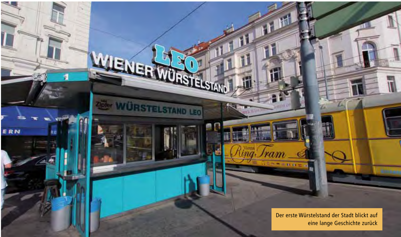
Der erste Würstelstand der Stadt blickt auf eine lange Geschichte zurück

will jeder Gast ein mageres Fleisch. Was sich aber nicht geändert hat, ist dass die Hot dog Käsekrainer die beliebteste Speise ist schon seit vielen Jahren“, so Tondl. Auch dem veganen Trend hat sich die Geschäftsfrau nicht widersetzt. „Vegane Würstel bieten wir mittlerweile auch an, die extra von einem Fleischhauer für uns gemacht werden und richtig gut schmecken. Mit den regulären Sojawürsteln in einem Supermarkt kann man das nicht vergleichen.“ Zwischen 200 und 400 Gäste kommen täglich zum Würstelstand Leo, wobei ca. ein Drittel davon Touristen sind.