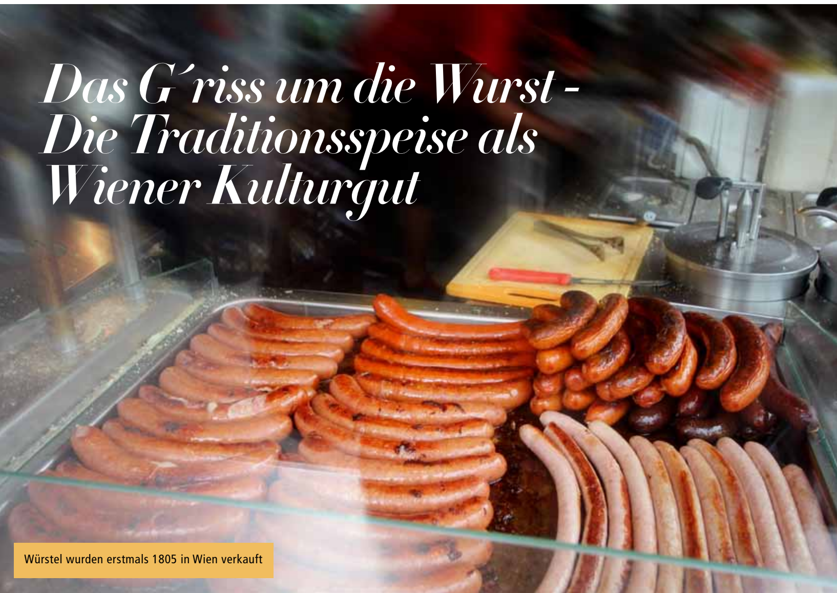
Würstel wurden erstmals 1805 in Wien verkauft

Würstelstände gehören zu Wien wie Sachertorte, Schloss Schönbrunn oder die Sängerknaben. Sie sind jahrzehntelanges heimisches Kulturgut, bei Einheimischen und Touristen beliebt und bringen unterschiedlichste Menschen von Straßenkünstlern bis Spitzenmanagern - zu jeder Tages- und Nachtzeit zusammen.